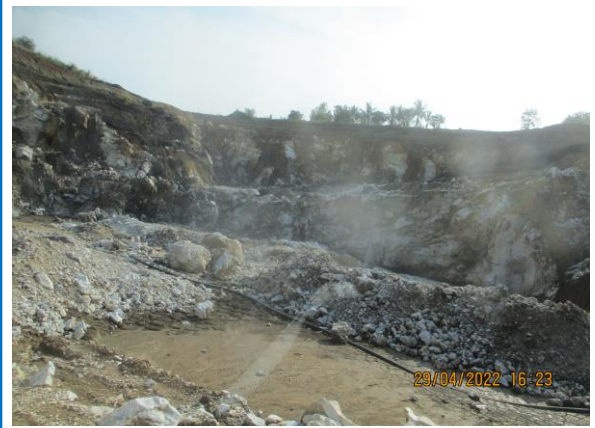
รูปที่ 3-6 สภาพหน้าเหมืองปัจจุบันแปลงประธานบัตรเลขที่ 29503/15112