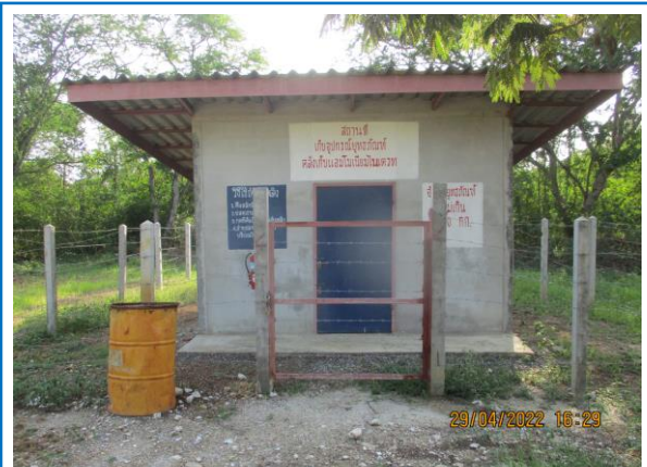
รูปที่ 3-7 สถานที่สำหรับเก็บวัตถุที่ใช้ในการระเบิดหิน