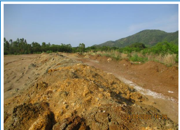
รูปที่ 3-11 คันทำนบดินล้อมรอบพื้นที่เก็บกองเปลือกดิน