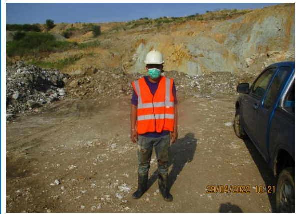
รูปที่ 3-21 คนงานสวมอุปกรณ์ป้องกันอันตรายส่วนบุคคล