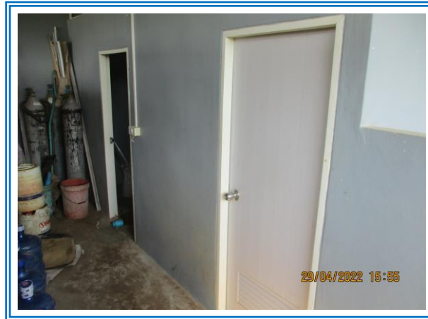
รูปที่ 3-26 จัดเตรียมห้องสุขาให้แก่พนักงาน