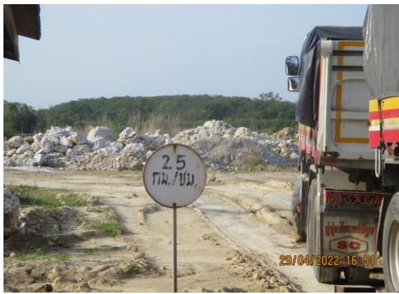
รูปที่ 3-20 จำกัดความเร็วไม่เกิน 25 กิโลเมตร/ชั่วโมง