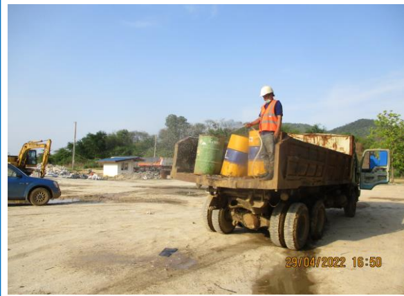
รูปที่ 3-16 ฉีดพรมน้ำเส้นทางขนส่งแร่