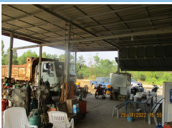
รูปที่ 3-24 โรงซ่อมบำรุง