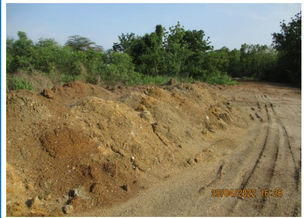
รูปที่ 3-10 พื้นที่เก็บกองเปลือกดิน