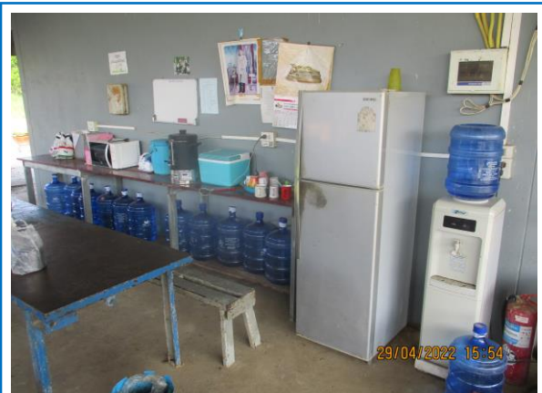
รูปที่ 3-25 จุดบริการน้ำดื่มให้กับพนักงาน