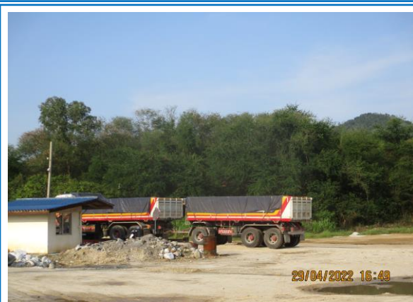
รูปที่ 3-17 ผ้าใบปิดคลุมกระบะบรรทุกให้มิดชิด