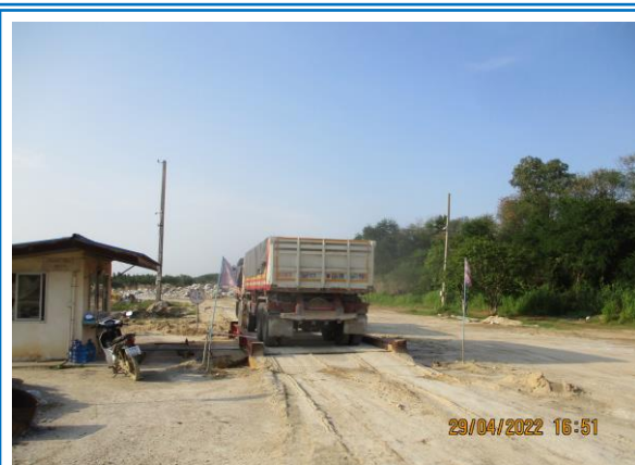
รูปที่ 3-18 ป้ายเตือน "ระวัง-มีรถบรรทุกเข้า-ออก"