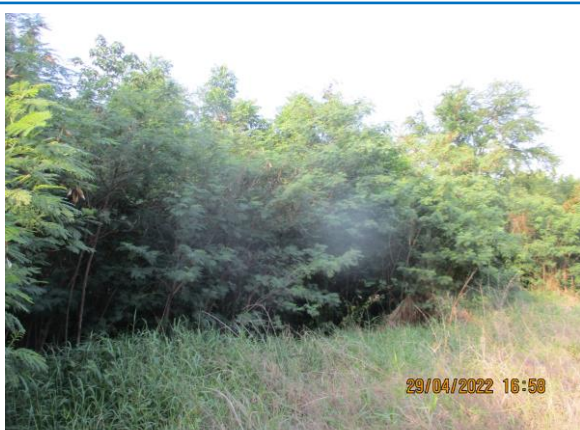
รูปที่ 3-22 ไม้ยืนต้นบริเวณริมถนนขนส่งแร่ภายในพื้นที่โครงการ