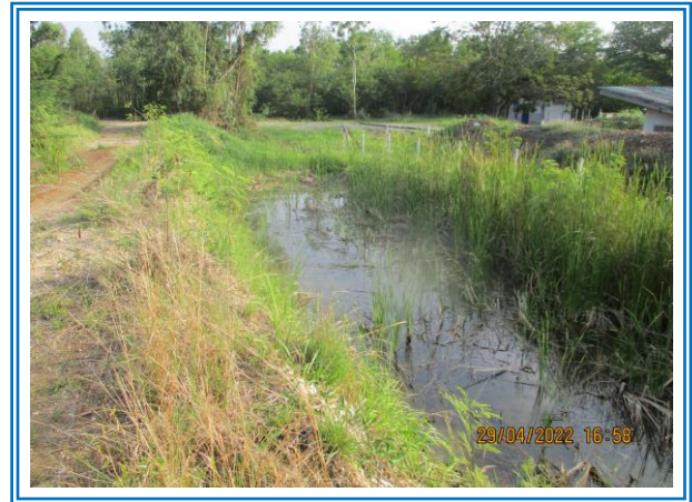
รูปที่ 3-13 คูระบายน้ำรอบพื้นที่โครงการ