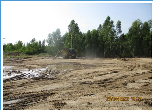
รูปที่ 3-23 ทบอยปรับถมพื้นที่ที่ผ่านการทำเหมืองแล้ว