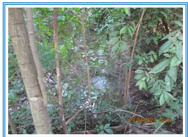
รูปที่ 3-15 คูระบายน้ำลงสู่ปอดักตะกอน