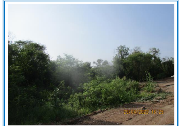
รูปที่ 3-1 เว้นพื้นที่ไม่ทำเหมืองตามแนวเขตประธานบัตรเลขที่ 29503/15112